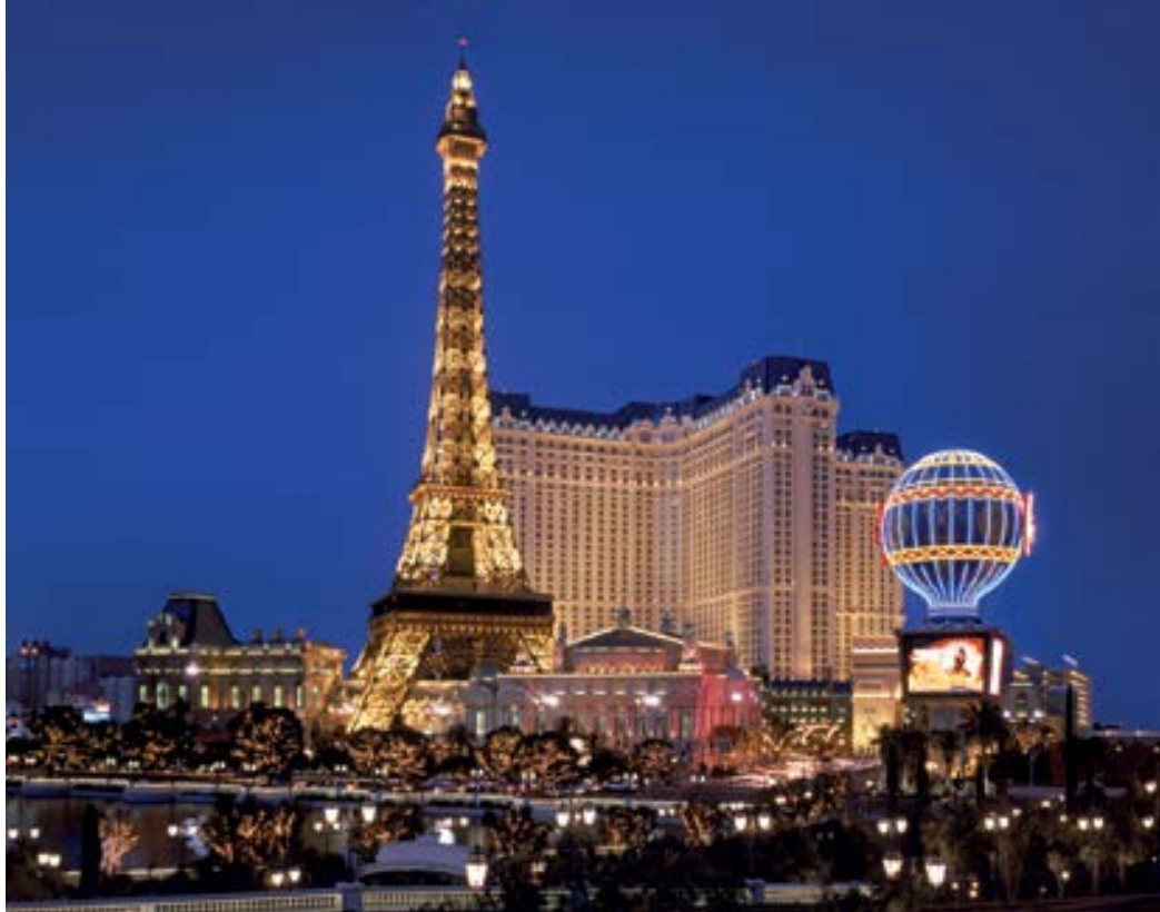
À l'hôtel-casino Paris de Las Vegas, le thème français est un argument de vente. La réplique de la Tour Eiffel est visible à plus de 500 kilomètres ! At the Paris Las Vegas Hotel & Casino, the French theme provides a real commercial advantage; the replica of the Eiffel Tower can be seen from 350 miles away!