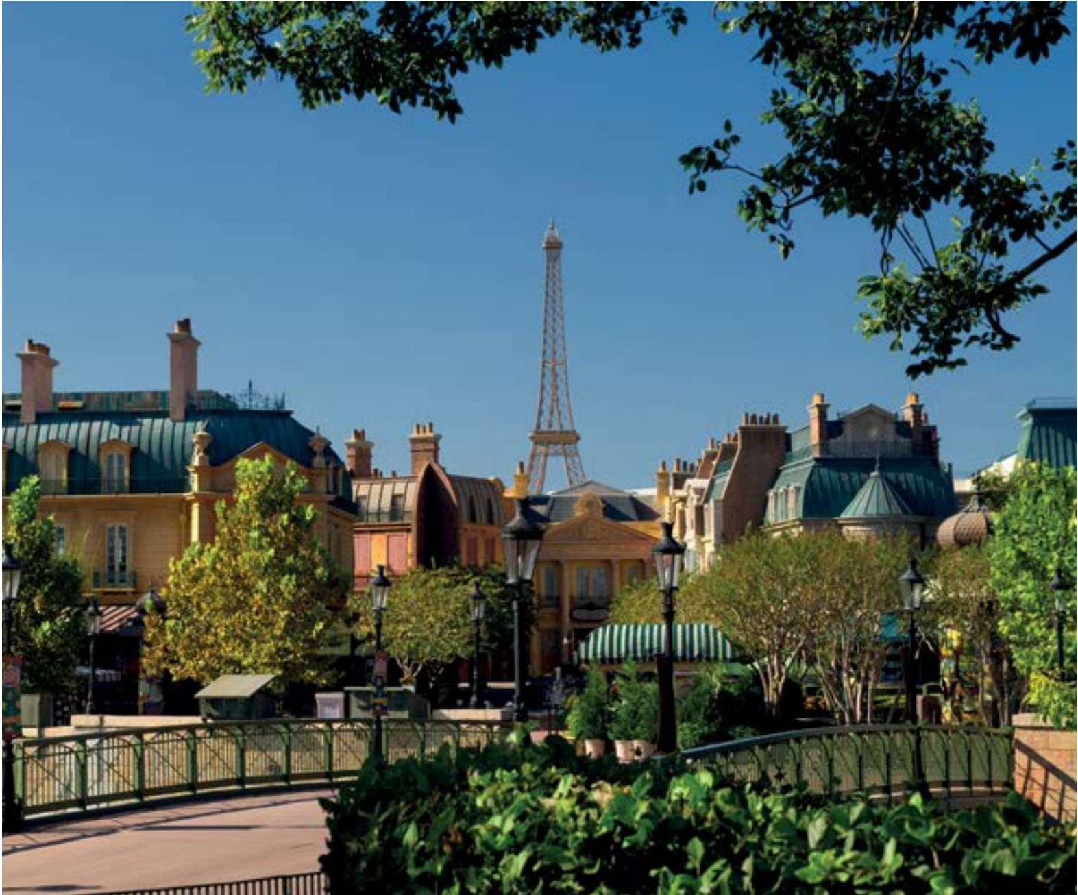
Bienvenue à Paris... en Floride ! Au parc d'attractions EPCOT, la passerelle qui mène au village français est une réplique du Pont des Arts. Welcome to Paris... in Florida! At the EPCOT theme park, the walkway leading to the French village is a replica of the Pont des Arts Bridge in the City of Light.