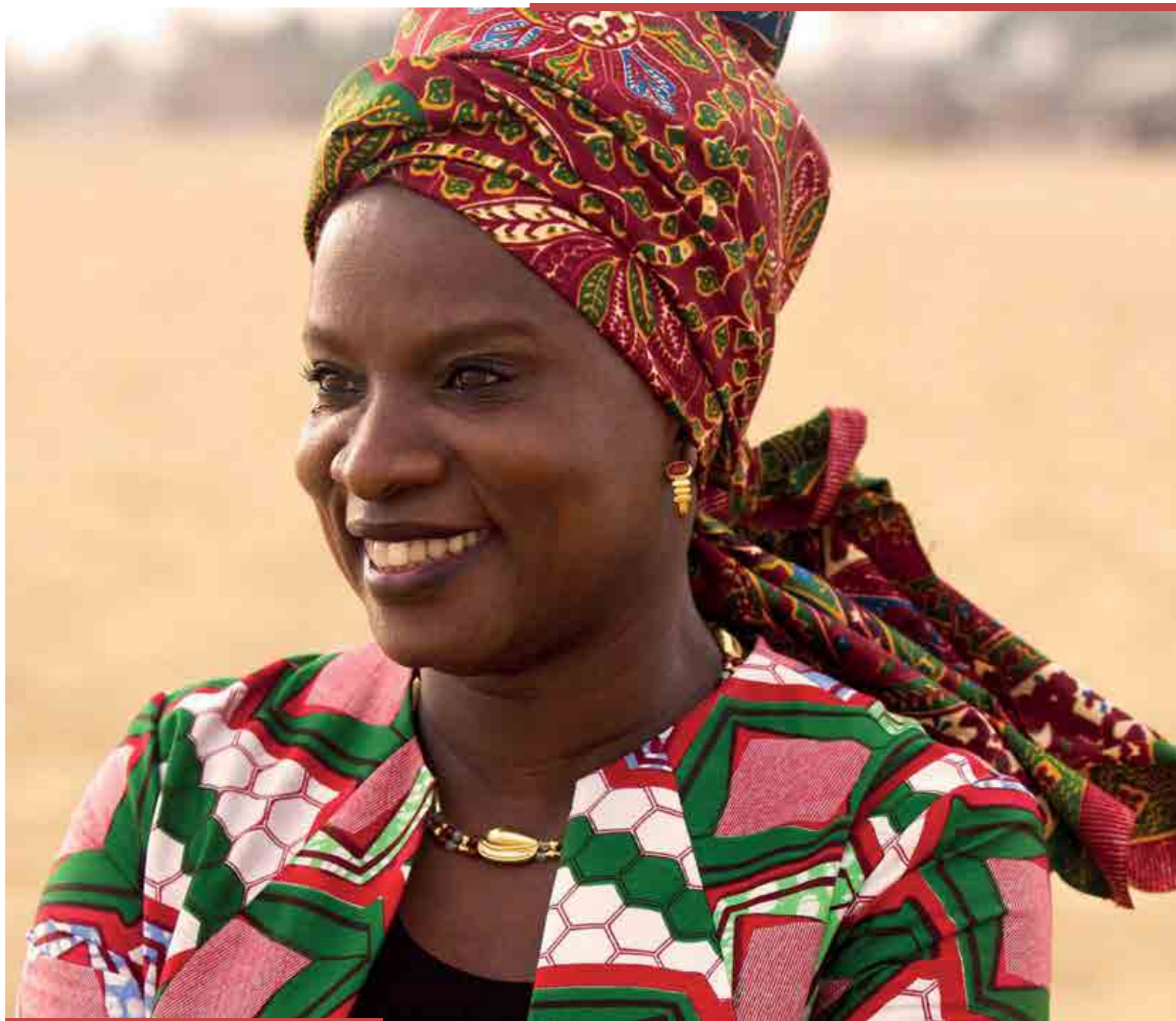
La chanteuse Angélique Kidjo, porte-voix de la francophonie, présente 21 e Siècle sur TV5Monde, une émission de reportages co-produit avec l'ONU. / Singer Angélique Kidjo, a figurehead of Francophone culture, hosts 21 e Siècle on TV5Monde, a news magazine show co-produced with the U.N.