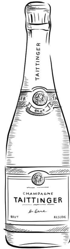
ILLUSTRATIONS: MAY VAN MILLINGEN

■ CLÉMENT THIERY, TRANSLATED FROM FRENCH BY ALEXANDER UFF